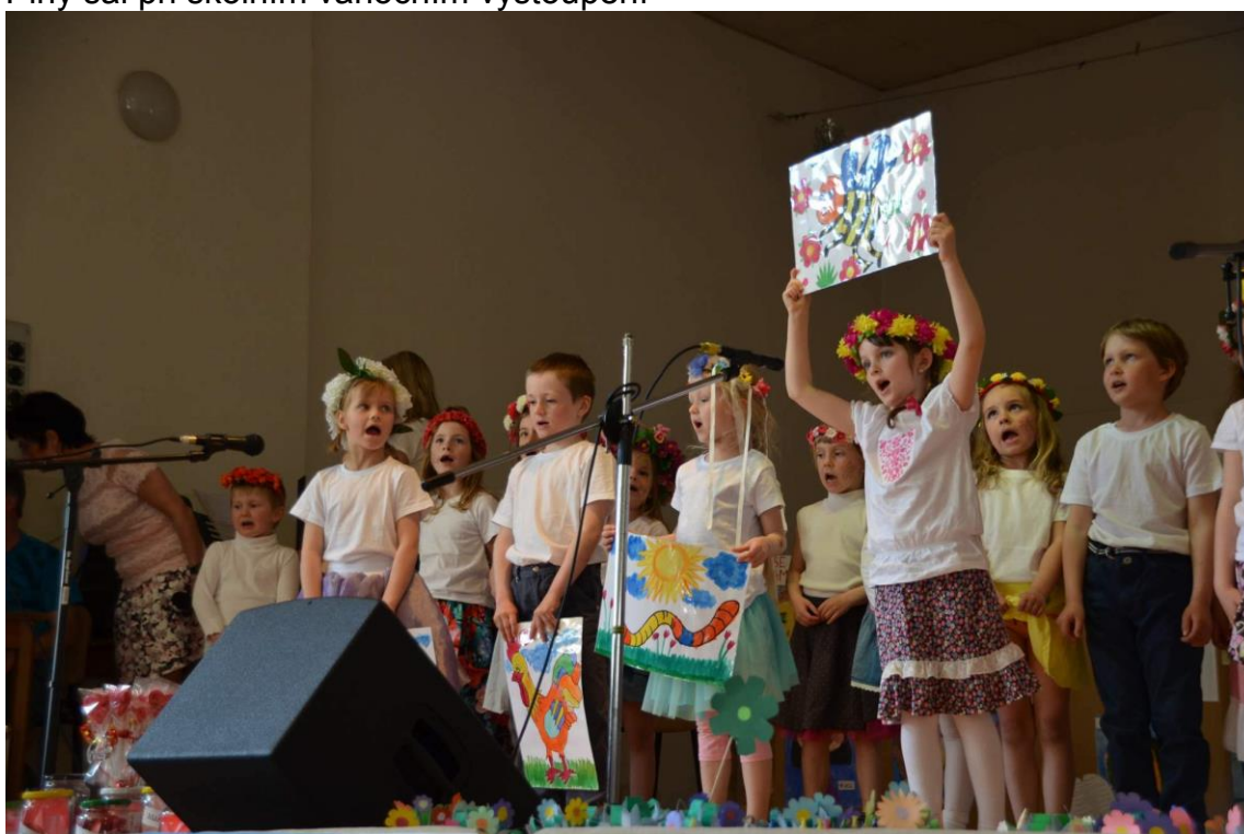
Besídka pro maminky