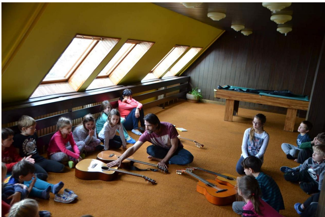
Hudební aktivity na horách