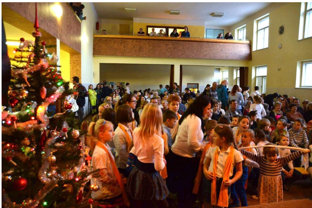
Plný sál při školním vánočním vystoupení