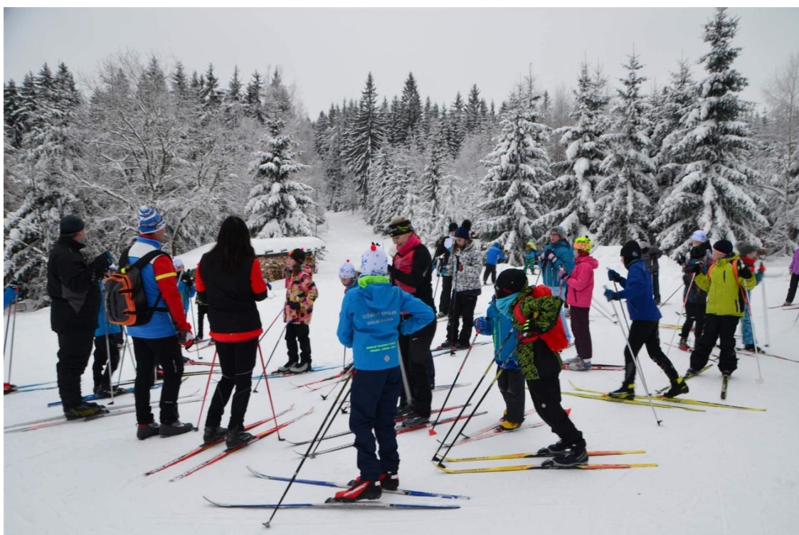
Sportovní aktivity na horách