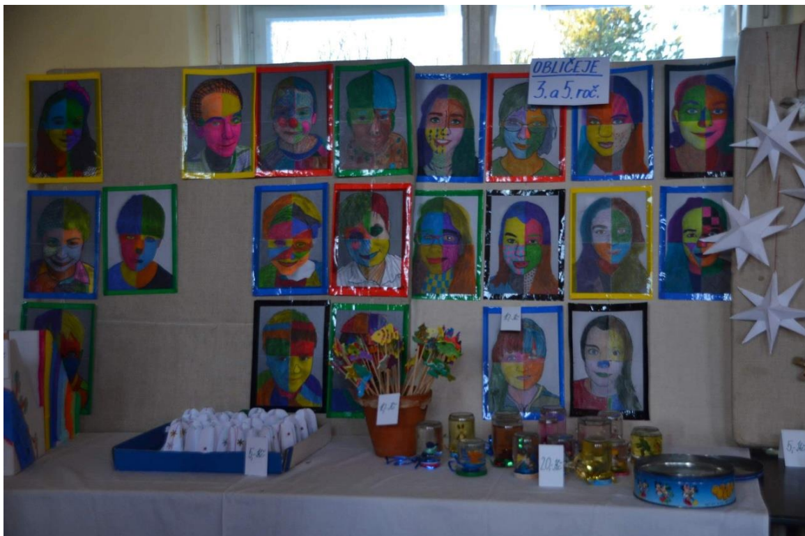
Výstavka výtvarných prací v KD