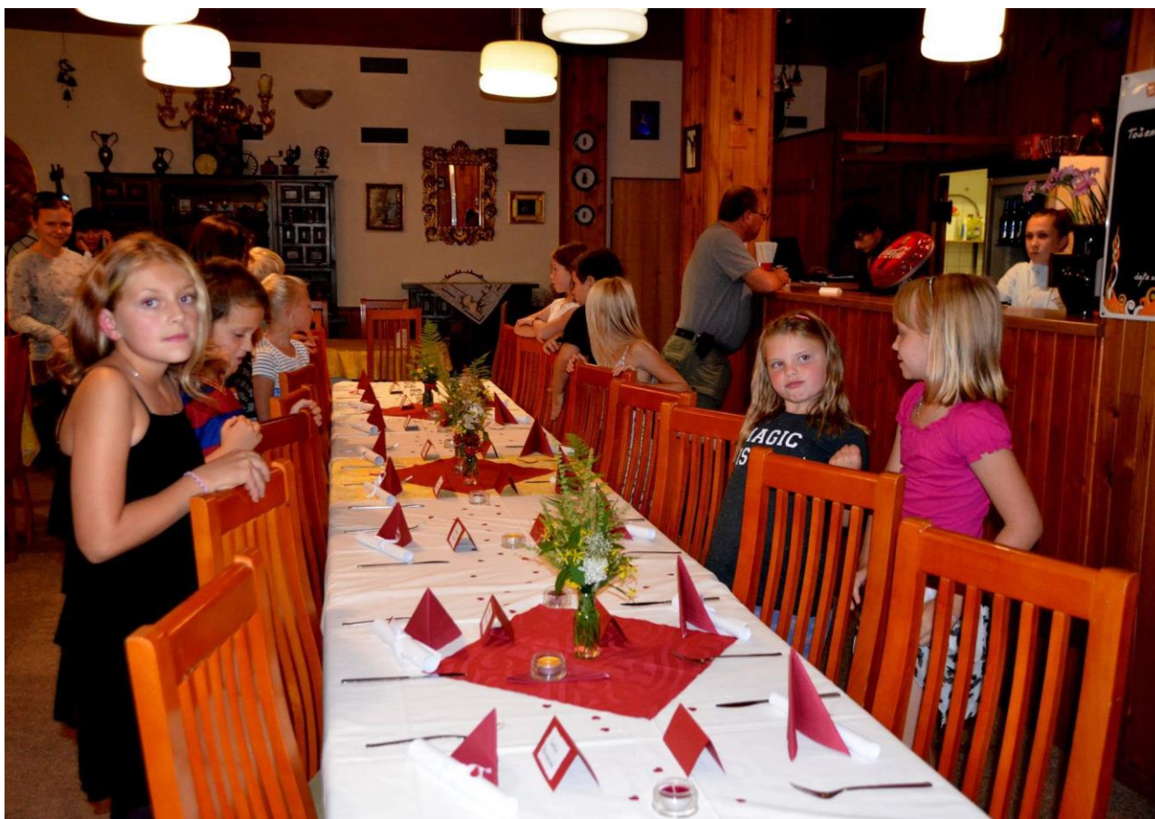
Hotel Žalý – Benecko - Základy stolování – příprava našich žáků pro hosty z Dolní Branné

Fotodokumentace z projektu KRAKONOŠOVA ETIKA: