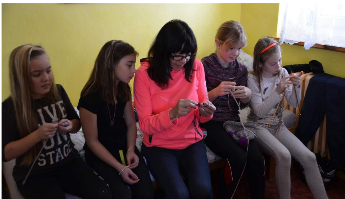
Výtvarné aktivity na horách