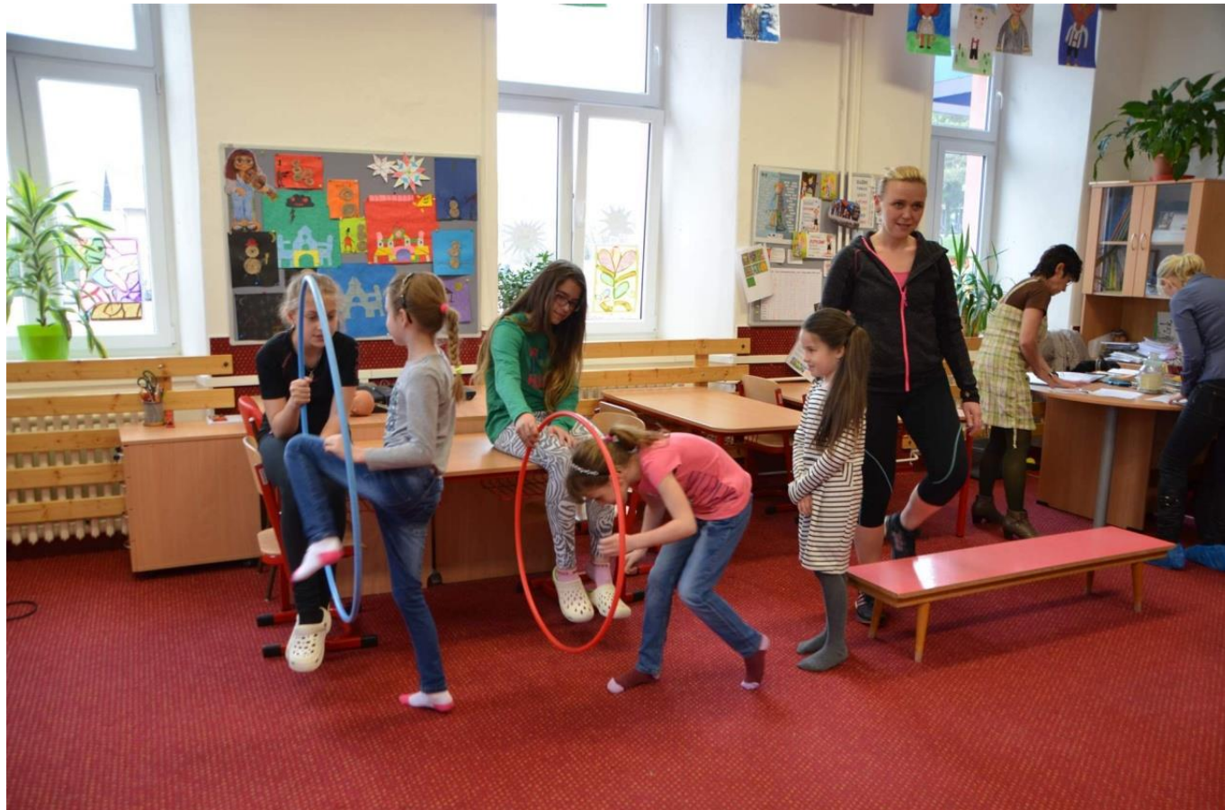
Zápis se sportovním nádechem