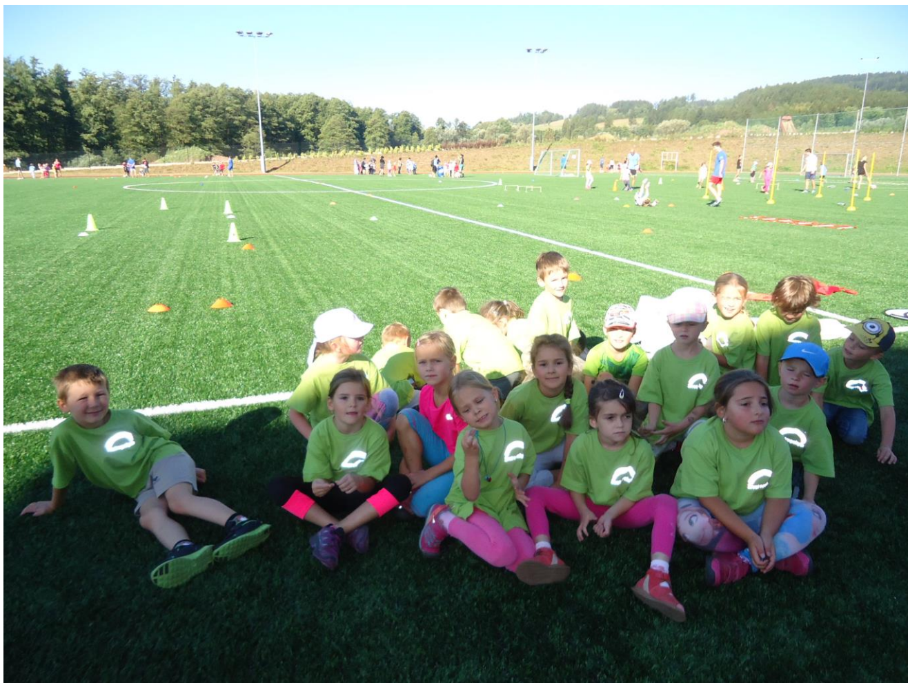
1. třída na fotbalovém stadionu ve Vrchlabí